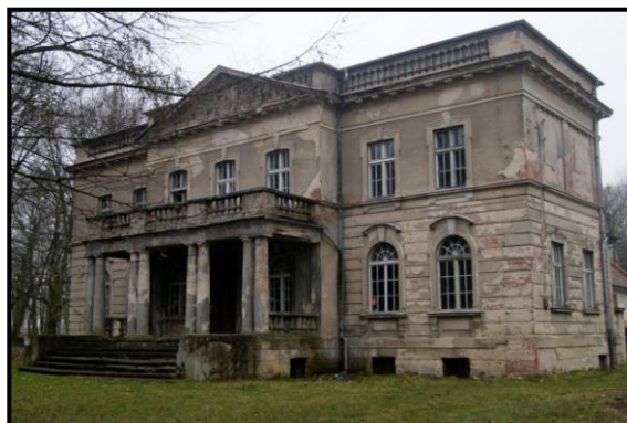
Zabytkowy pałac z końca XIX w