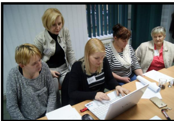
Grupa Odnowy Wsi w czasie warsztatów opracowania Sołeckiej Strategii Rozwoju. Gminny Ośrodek Kultury w Nowym Mieście nad Wartą, dnia 11-12.III.2016r.