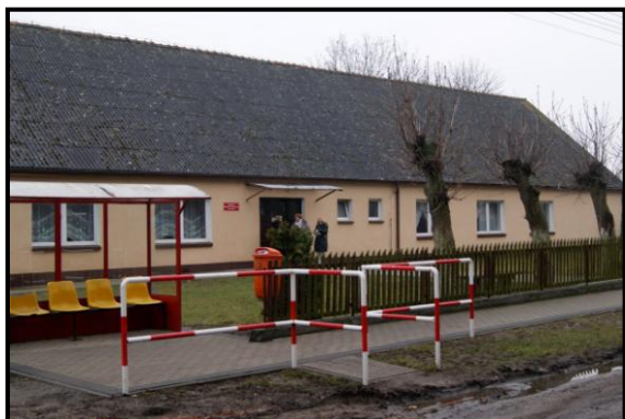
Budynek świetlicy wiejskiej